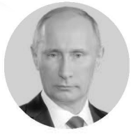
Владимир Путин, Президент Российской Федерации

“ У Минсельхоза много программ по поддержке сельского хозяйства. И большие деньги государство выделяет. Но, конечно, без активного, с полной отдачей труда селян ничего бы не было. А результаты в целом хорошие. ”